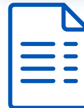
Схема жана нускама

Акча которууга билдирмени жана аны негиздөөчү документтерди Ыйгарым укуктуу банкка жөнөтүү схемасы